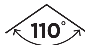
ANGLE DE FAISCEAU