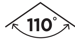
ANGLE DE FAISCEAU